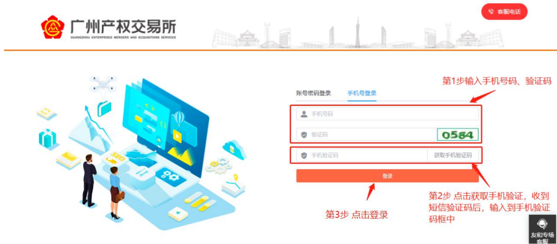
图 1-4 竞价专场登录页