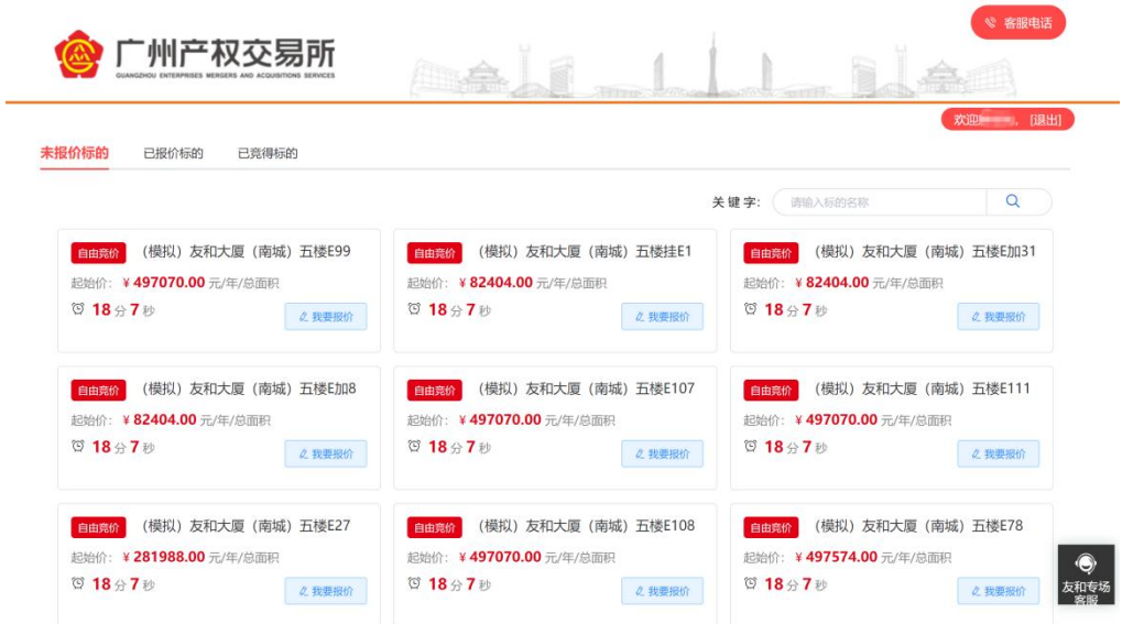
图 2-1 未报价标的列表