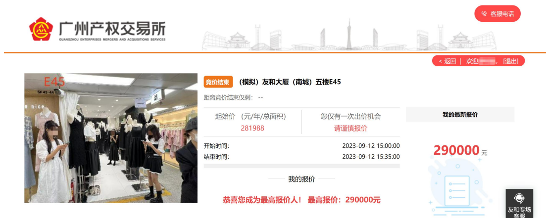
图 4-2 已竞得标的详情