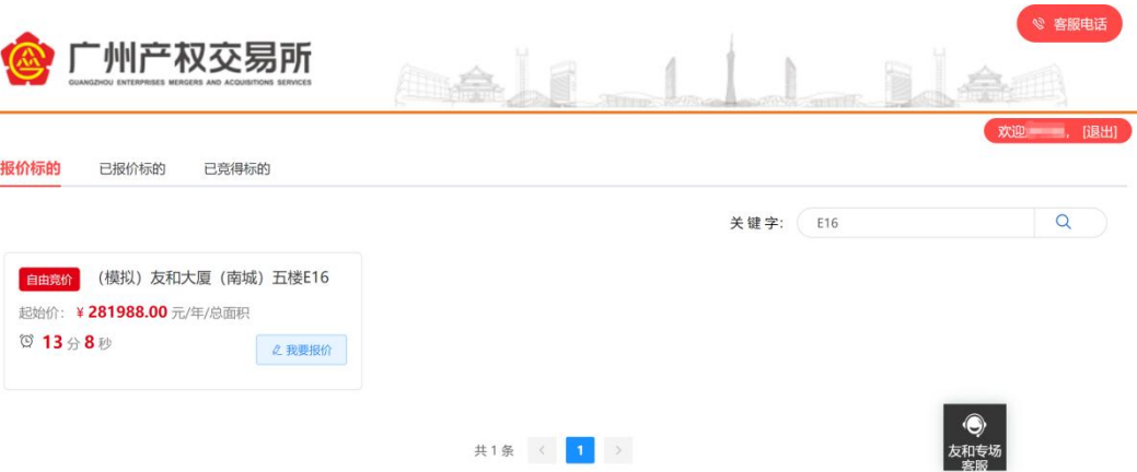
图 2-3 未报价标的搜索结果