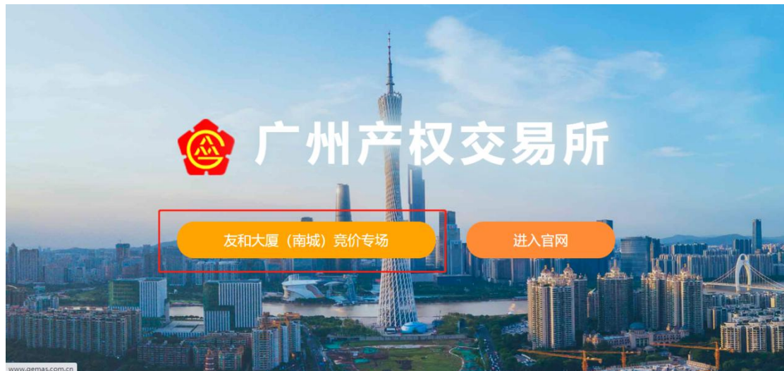
图 1-2 网站首页

2、点击“友和大厦（南城）竞价专场”进入登录页，输入注册时的用户名、密码和验证码进行登录。