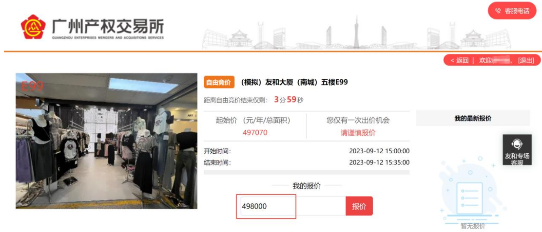
图 3-3 报价页面