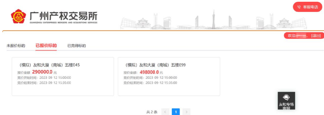
图 3-6 已报价标的