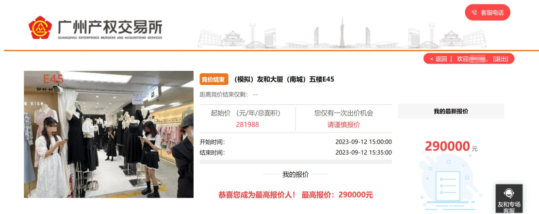
图 3-7 竞价结束_最高报价人页面