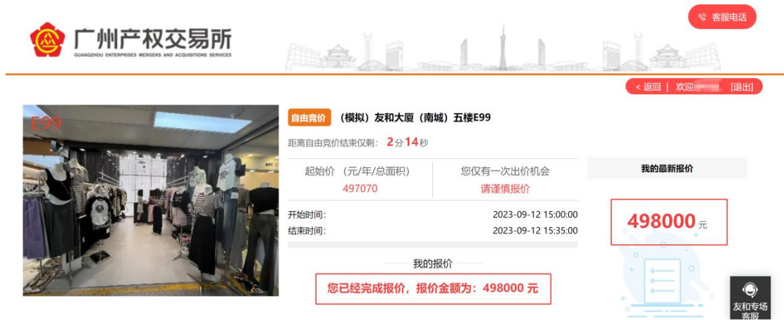
图 3-5 报价成功