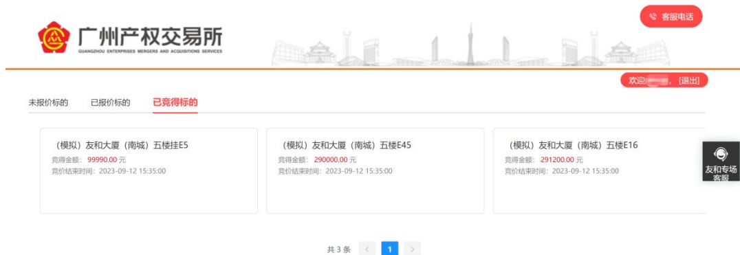
图 4-1 已竞得标的