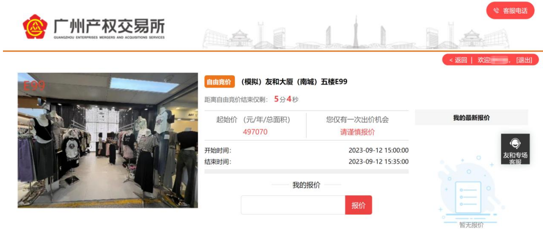
图 3-2 报价页面

在报价页面，会展示当前标的所处竞价阶段、起始价格、竞价开始时间/结束时间、我的最新报价等信息。