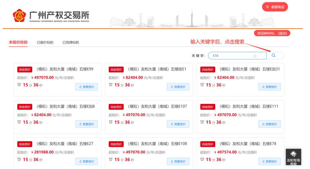
图 2-2 未报价标的搜索