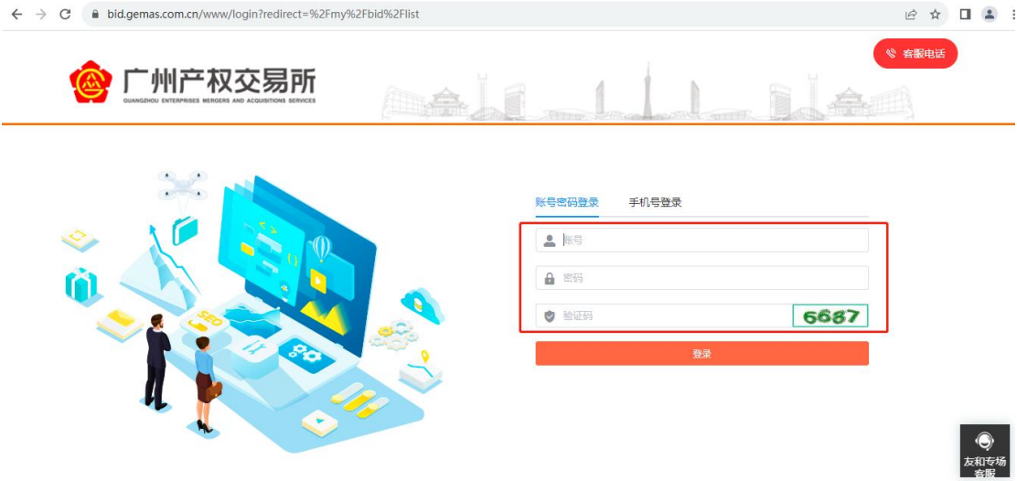
图 1-3 竞价专场登录页