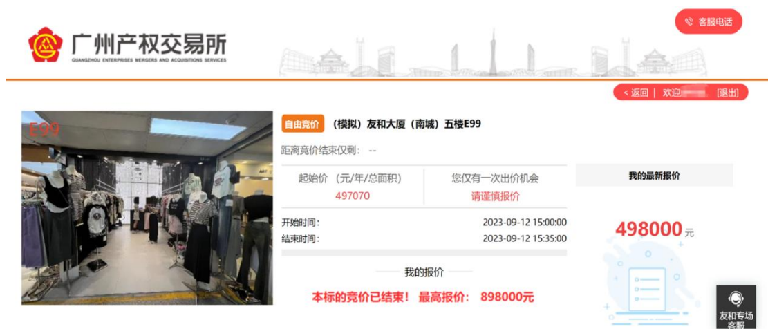
图 3-8 竞价结束_非最高报价人页面