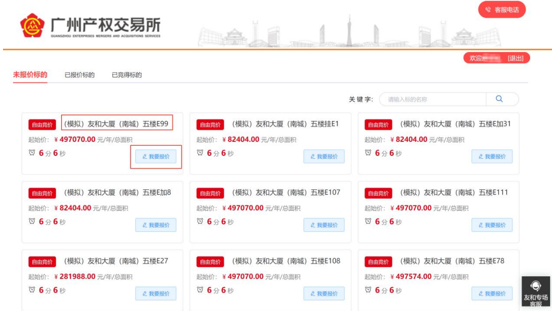
图 3-1 未报价标的

进入“未报价标的”后，您可以在竞价标的列表中，选择要参与竞价的标的，点击“标的名称”或“我要报价”前往报价页面进行报价。