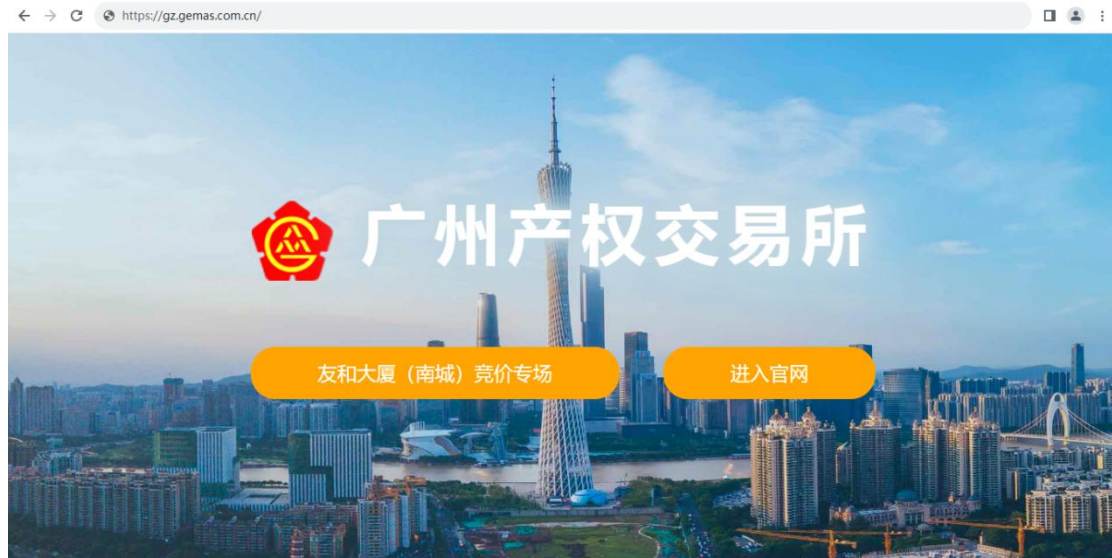
图 1-1 网站首页

1、打开浏览器，输入广州产权交易所网址： https://gz.gemas.com.cn/ 。